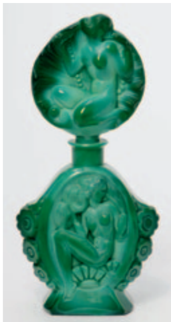
«Aladin» von Les Parfums de Rosine aus dem Jahr 1919 (ganz links) und ein Malachitglas-Flacon aus den 1910er-Jahren (links).

Eigentlich sind Parfums ja vor allem etwas für die Nase. Aber das Auge riecht mit, könnte man das alte Sprichwort abwandeln. Das wissen natürlich auch die Hersteller der Wässerchen, die uns in jeder Beziehung teuer sind. Und deshalb kümmern sie sich nicht nur intensiv um die richtige Zusammensetzung der Düfte, sondern auch um deren schöne und verkaufsfördernde Umhüllung.